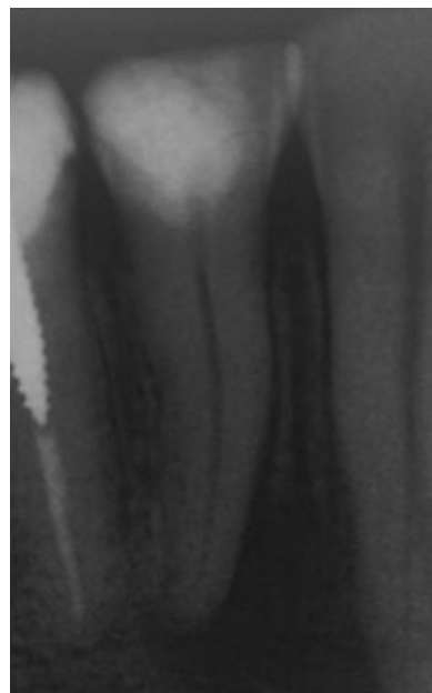
Rycina 1. Rtg zębowe. Widoczna zmiana typu przewlekłego zapalenia tkanek okołowierzchołkowych wokół pierwszego przedtrzonowca żuchwy spowodowana martwicą miazgi wskutek nieodpowiedniego wypełnienia ubytku próchnicowego

Istotną rolę w procesie diagnostycznym odgrywają metody radiologiczne. Ze stosowanych w rutynowej diagnostyce stomatologicznej projekcji, do wykrywania obecności zmian typu przewlekłego zapalenia tkanek okołowierzchołkowych stosuje się zdjęcia zębowe i pantomograficzne ( ryciny 1 i 2 ) [5, 7]. Opublikowane dotąd badania wskazują na to, że obie metody są skuteczne w identyfikacji ognisk zapalnych i nie obserwuje się dużych różnic pomiędzy nimi ( tabela 1 ).