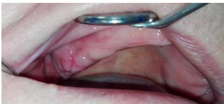
Rycina 6. Guz wyrostka zębodołowego szczęki po zabiegu chirurgicznym Figure 6. The shape of the maxillary tuberosity after surgical corrective treatment