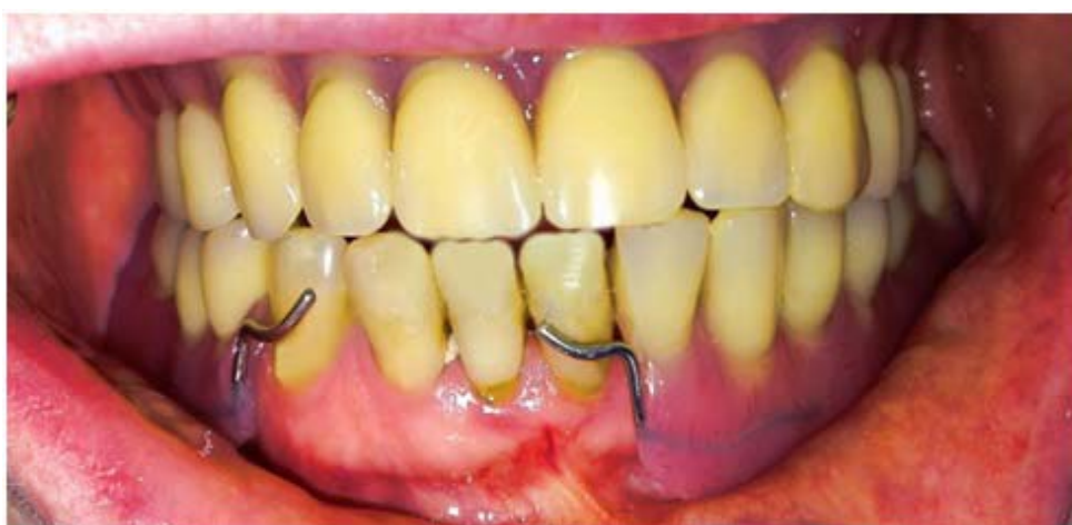
Rycina 11. Zdjęcie wewnątrzustne pacjentki z zespołem Kelly'ego po zakończonym leczeniu protetycznym