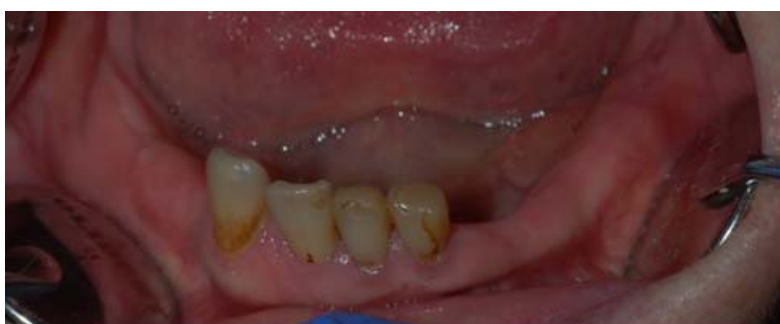
Rycina 4. Zdjęcie wewnątrzustne pola protetycznego w żuchwie Figure 4. Intraoral view of the denture supporting tissues in the mandible