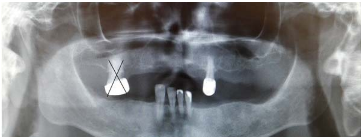
Rycina 2. Zdjęcie OPG pacjentki wykonane przed leczeniem chirurgiczno-protetycznym

Figure 2. Orthopantomogram of the patient before commencing the surgical and prosthetic treatment