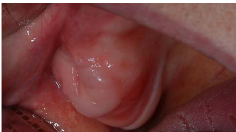
Rycina 5. Przerost włóknisty guza wyrostka zębodołowego szczęki przed zabiegiem chirurgicznym Figure 5. Fibrous overgrowth of maxillary tuberosity before surgical treatment