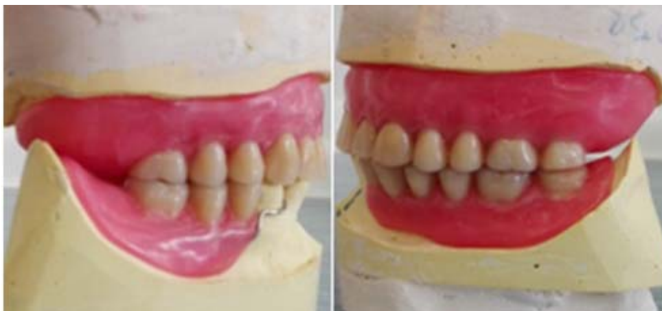
Rycina 10. Kontrola protez próbnych na modelach roboczych