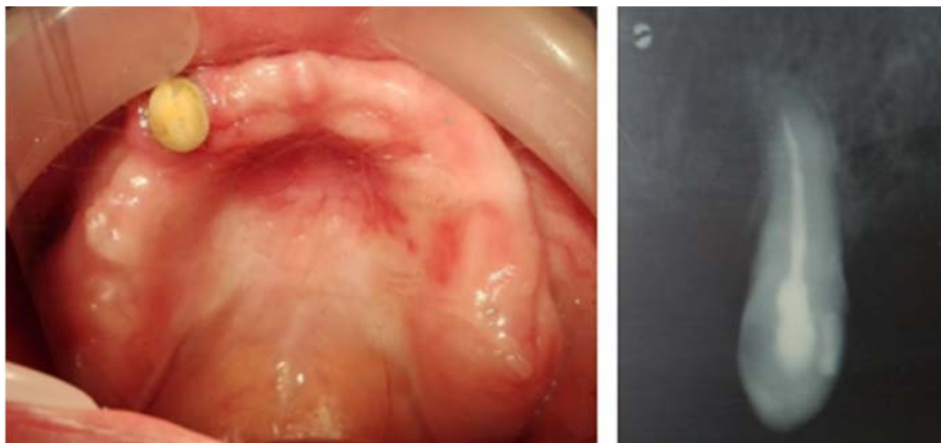
Rycina 7. Stan po zdjęciu korony lanej z zęba 23 oraz zdjęcie rtg zęba 23 po leczeniu endodontycznym

niu przeciwgrzybiczym wykazało ujemny wynik. Pacjentka była zadowolona z fiksacji i stabilizacji oddanych uzupełnień protetycznych, co stworzyło dobre warunki do ich szybkiej adaptacji.