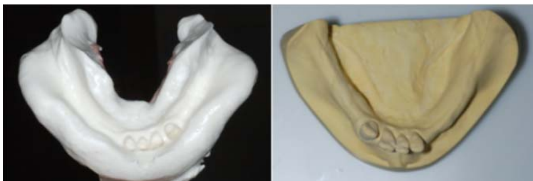
Rycina 8. Wycisk anatomiczny żuchwy i model roboczy dolny