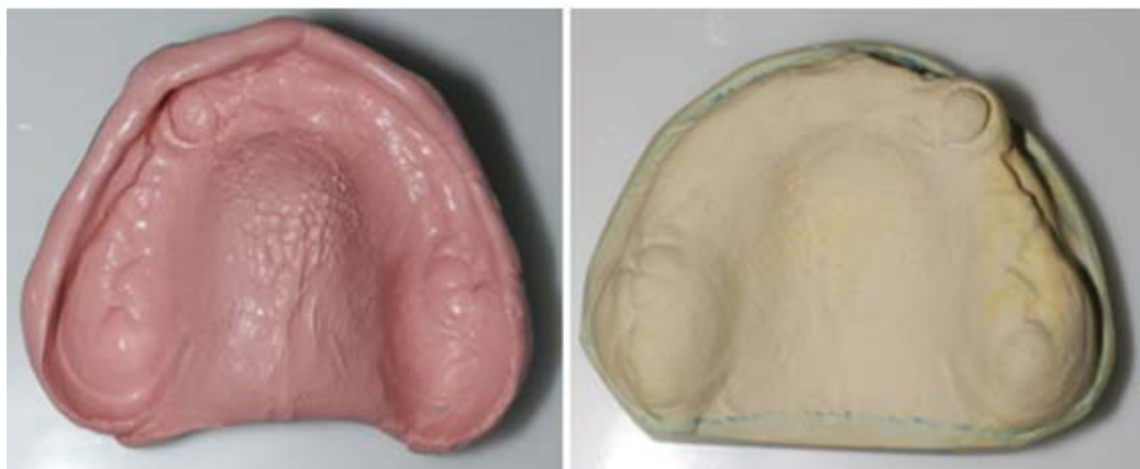
Rycina 9. Wycisk czynnościowy szczęki i model roboczy górny