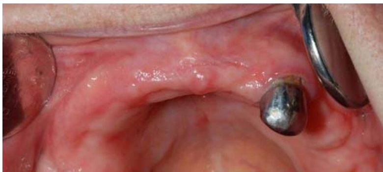
Rycina 3. Zdjęcie wewnątrzustne wyrostka zębodołowego szczęki Figure 3. Intraoral view of the maxilla