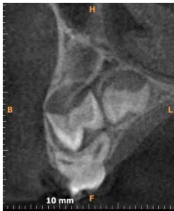
Rycina 3. Zawiązki zębów 15 i 14 są widoczne na przekroju transsektalnym

Figure 3. Germs of teeth 15, 14 are visible on sagittal CBCT scan