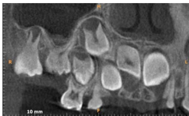
Figure 1. Coronal CBCT scans. Reincluded tooth without visible features of physiological root resorption