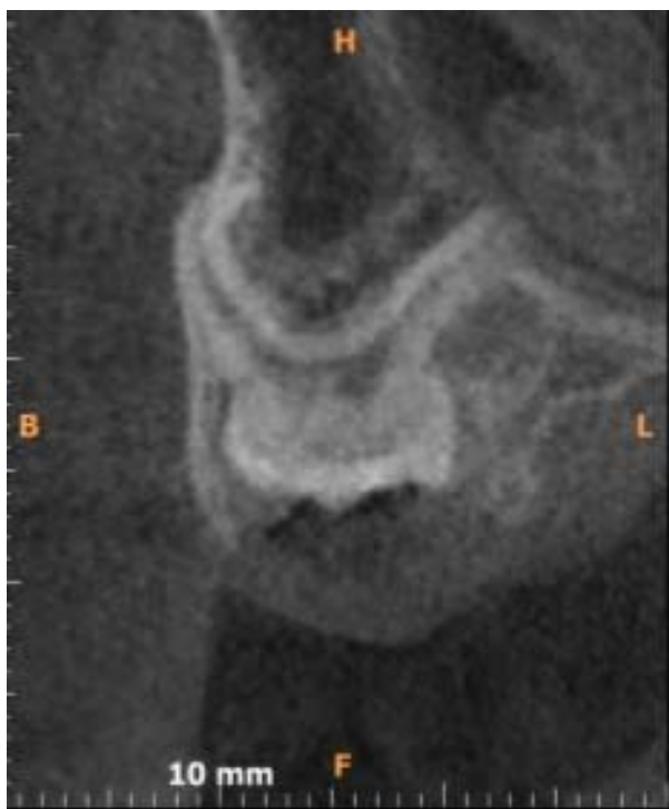
Rycina 2. Przekrój transsektalny zęba 55