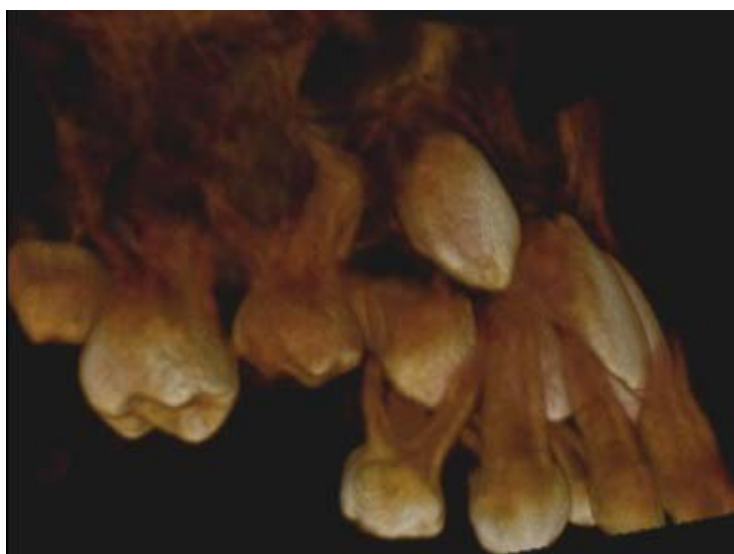
Rycina 5. Rzut pseudotrójwymiarowy zęba 55