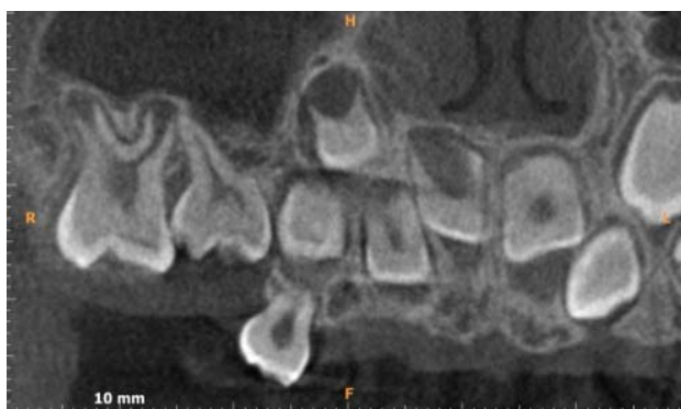
Rycina 1. Przekroje styczne. Widoczny reinkludowany ząb 55 bez cech resorpcji korzeni

Sześciolatnia pacjentka została skierowana na badanie CBCT, które wykonano aparatem Kodak 9000 3 o polu obrazowania (FOV) 37 mm wysokości, średnicy 50 mm. Obrazowana objętość uwidoczniła zawiązki zębów stałych od 16 do 23, zęby mleczne w łuku od 54 do 62 oraz reinkludowany ząb 55 ( Rycina 1 ). Korona prawego górnego drugiego mlecznego zęba trzonowego